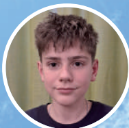
Lukas Walther Weinbergweg 8